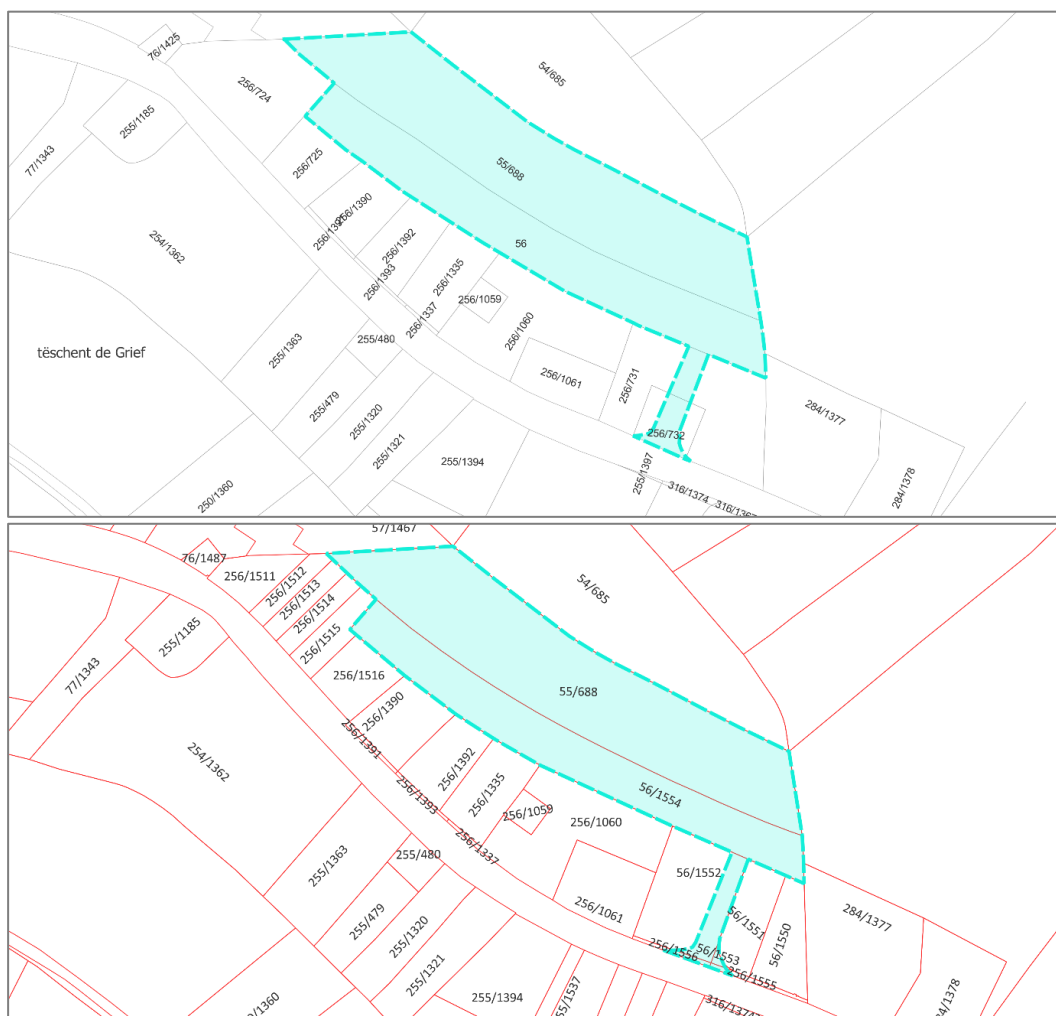
ABBILDUNG 2 : AUSZUG PCN 2017 (OBEN) UND 2023 (UNTEN) MIT KENNZEICHNUNG DES ÄNDERUNGSBEREICHS

QUELLE: EIGENE DARSTELLUNG; DATENBASIS: ADMINISTRATION DU CADASTRE ET DE LA TOPOGRAPHIE (ACT); LETZTER ZUGRIFF : 06/2023